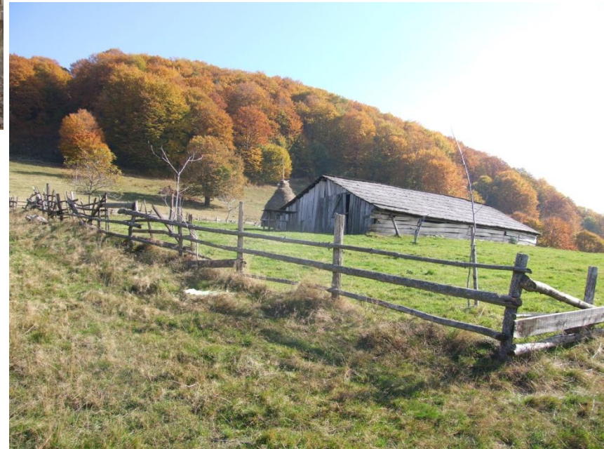
Fig. 5. Pășuni montane