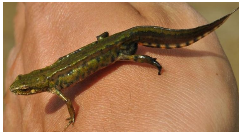
Fig. 3. Triturus montandoni