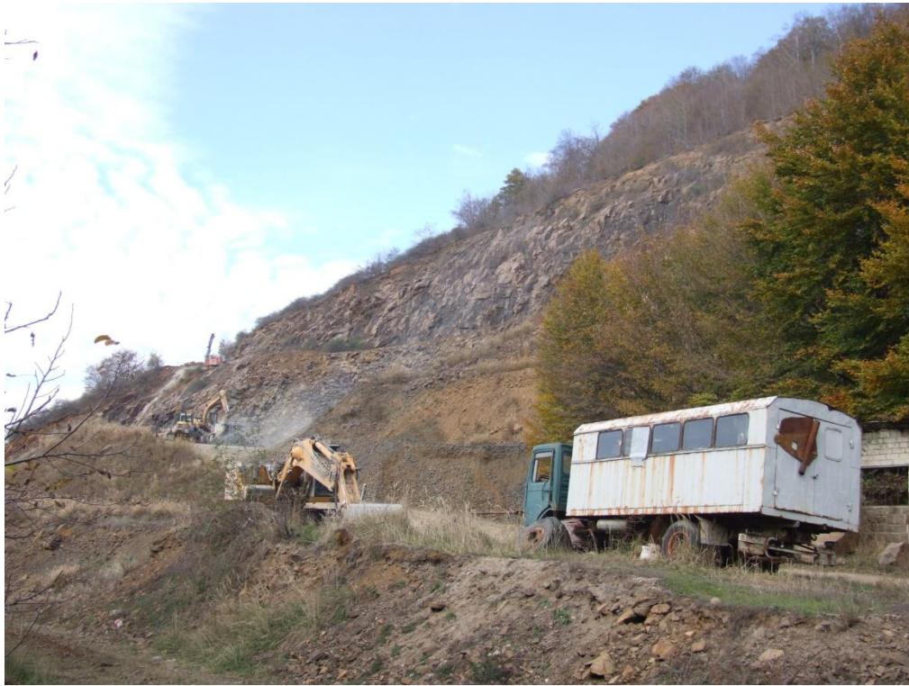
Fig. 4. Cariera Huta Certeze