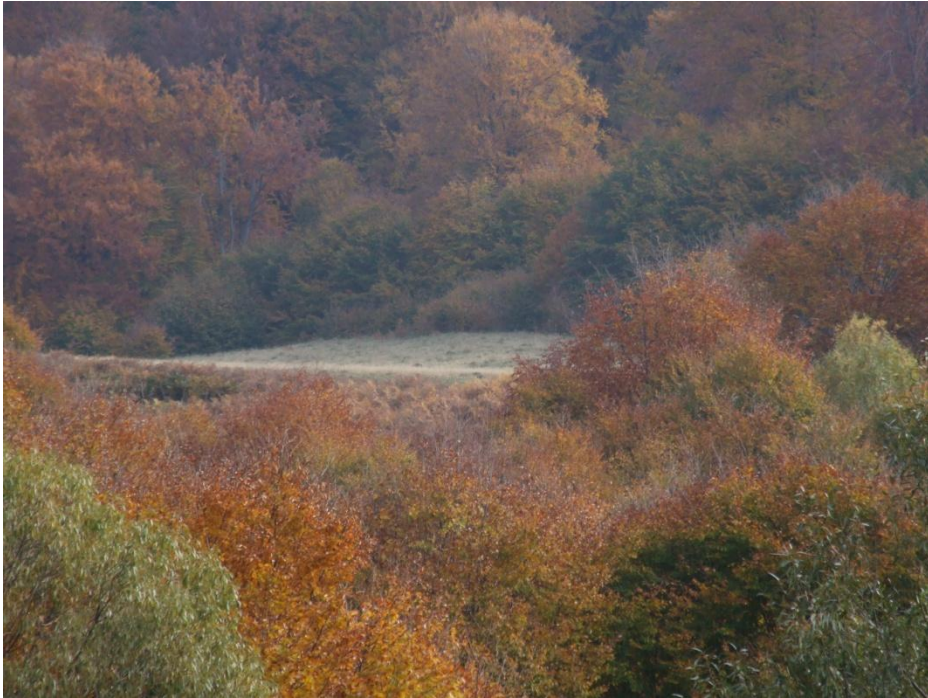
Fig. 6. Pădure de fag