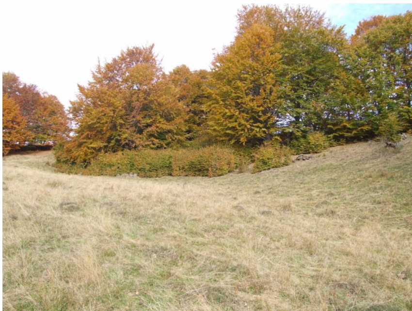
Fig. 8. Pajiște montană