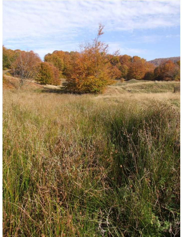
Fig. 7. Pajiște invadată de pipirig