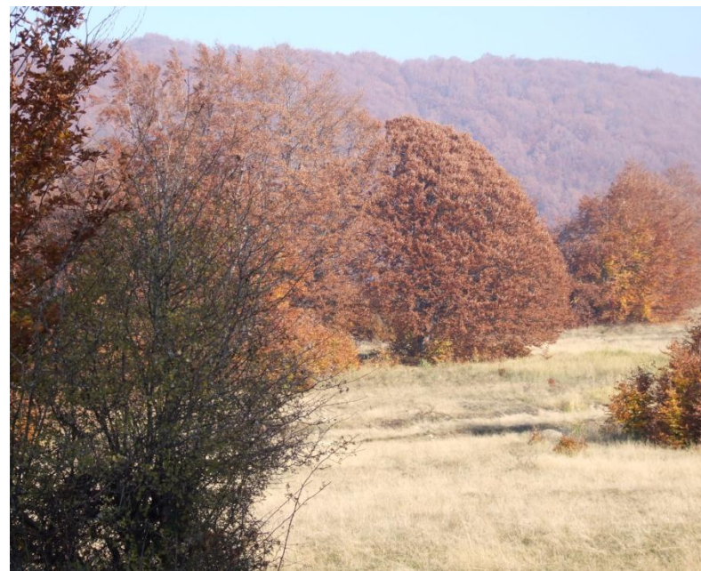
Fig. 1. Păduri de fag