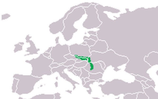
Fig. 2. Răspândirea speciei de Triturus montandoni