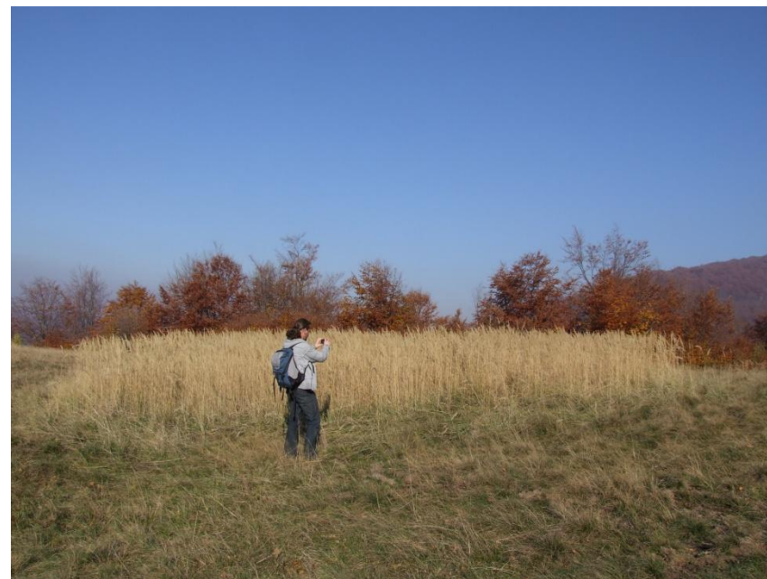
Fig. 6. Pajiște invadată de Calamagrostis epigeois